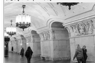
富麗堂皇的地鐵站