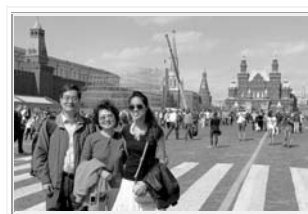
莫斯科「紅場」（背後正在搭閱兵看台）

「漠然的俄國人」—不論在地鐵或馬路上，你看到的都是沒有表情的人，即使直接打了照面，他們也有如看到一棵樹木，不要期望有人喧嘩，也沒有必要主動去說「嗨」。這種壓抑的個